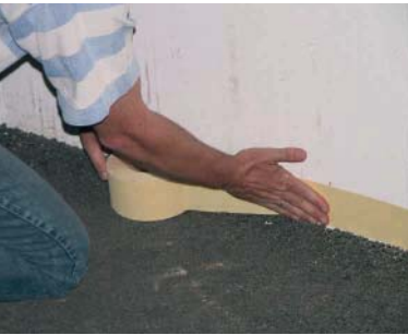
Reinigen und Abkleben